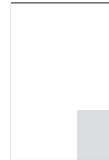
1sp. 82 × 105 mm