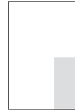
1/6 82 × 210 mm