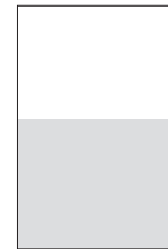
1/2 255 × 210 mm