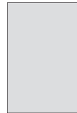
1/1 255 × 420 mm

Anzeigenpreise verstehen sich zuzüglich der gesetzlichen Mehrwertsteuer. Sonderkonditionen und Platzierungswünsche nach telefonischer Vereinbarung.