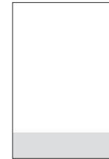
1/6 255 × 68 mm