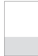
1/3 255 × 135 mm