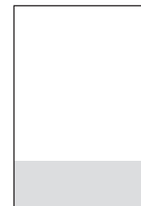
1/4 284 x 100 mm